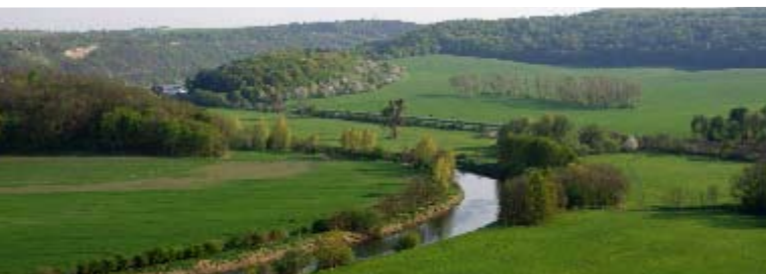
Unstrutbogen bei Zingst