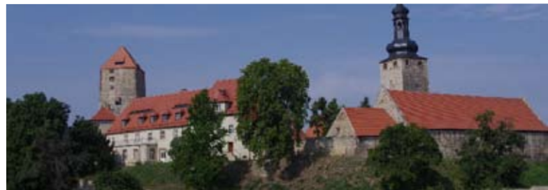
Burg Querfurt - Burgpanorama

Nach der Schlacht bei Skidingi fällt die Gegend nördlich der Unstrut den Sachsen zu. Diese jedoch hält es nicht lange und so ziehen sie 568 mit den Langobarden auf die Eroberungszüge in die warme Lombardei (Norditalien). Schwaben, Friesen und Hosinger besetzen die Gegend. Vitzenburg im Hosgau liegt nahe der Grenze zum Friesenfeld. Neben