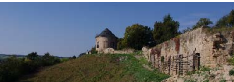
Weinberg Vitzenburg und Pavillion

Ein trockener Weißwein, ein Baguette, Oliven und Käse, ein gut geräucherter Schinken frisch aus dem Wanderrucksack.